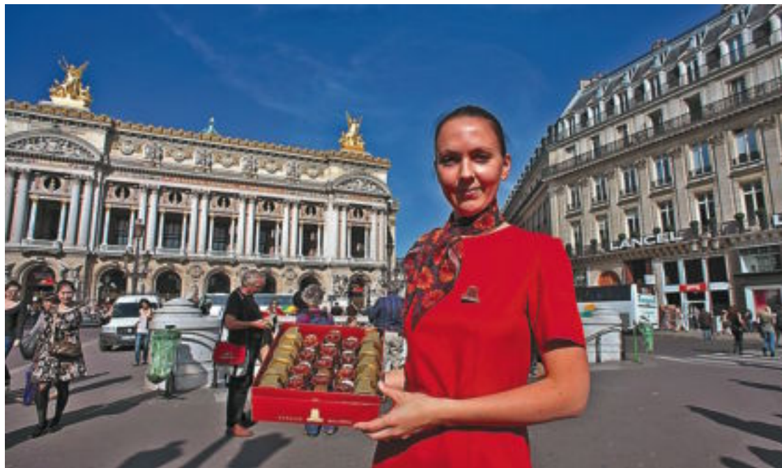
La confitería Baillardran, a un paso de la Ópera, es famosa por sus bombones bañados de caramelo.

de lujo del restaurante que Takashima elige para darse un homenaje cerca de la plaza de Contrescarpe. La Truffière ofrece esa cocina honesta que sigue temporada y mercado con devoción religiosa. La reina de los platos es la trufa con nombres y apellidos: tuber melanosporum . "Normalmente es del Perigord, pero últimamente la encontramos más hacia el sureste, en el departamento de Drôme". El inquieto manjar se sirve en generosos raviolis, y de aperitivo hay guñones japoneses como los sakes de Okumusahi para pasar un exquisito foie rodeado, como los sushis , de alga nori . El menú ronda los 80 euros, pero se graba en la memoria como la magdalena de Proust.