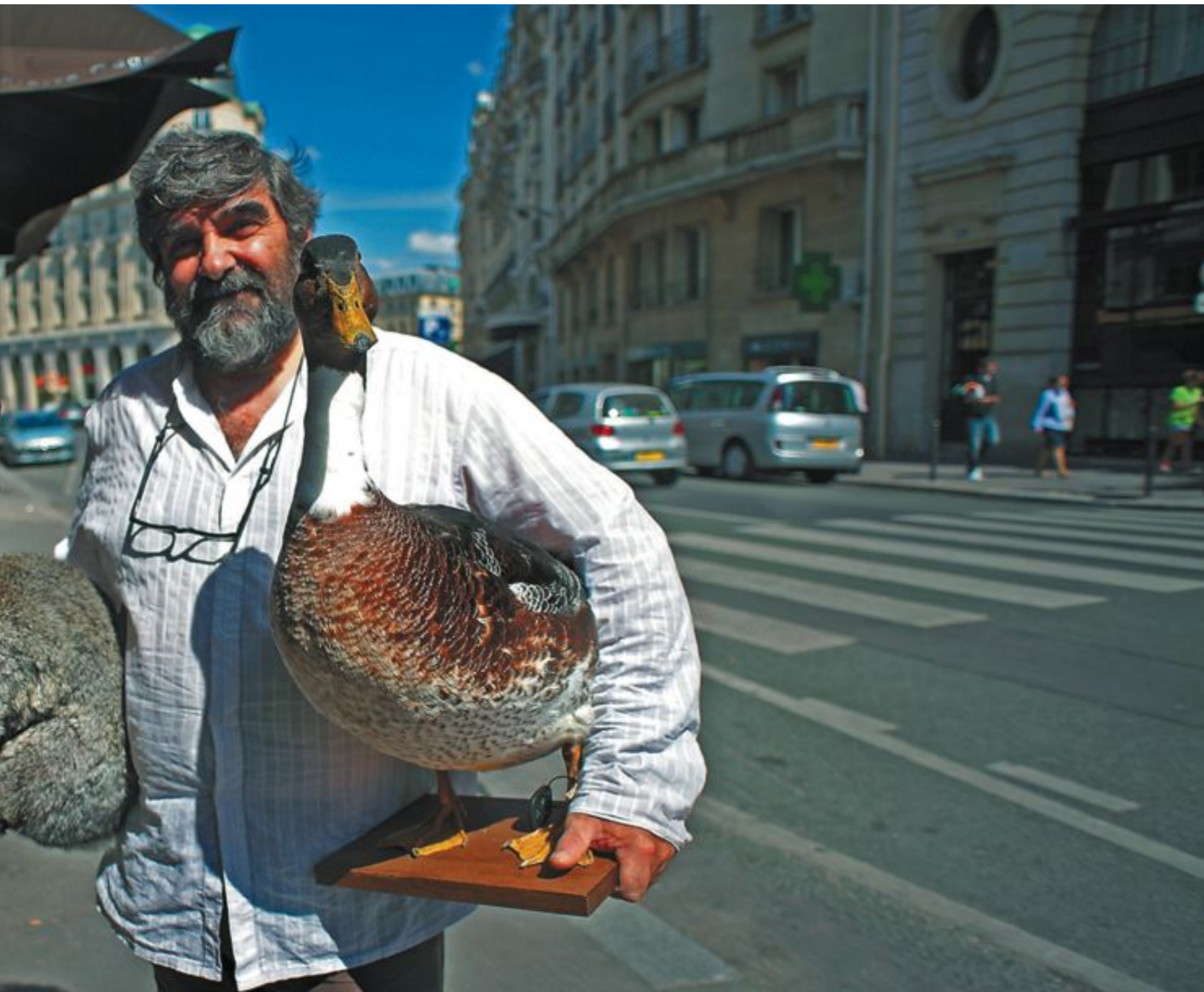
La tienda de taxidermia Deyrolle, en la parisense Rue de Bac.

testas. Hoy, viendo un rostro es capaz de trazar su gorro exacto en 48 horas e incluso los diseña por parejas. “A las japonesas les va bien una gorra moldeable de colores, que proteja la piel. Y para ellos, un sombrero de ala ancha, de tono neutro, que sombree la mirada. Los dos se acompañan a la perfección”.